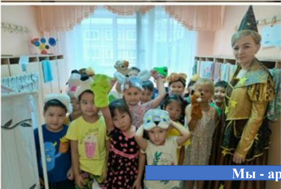
Мы - артисты