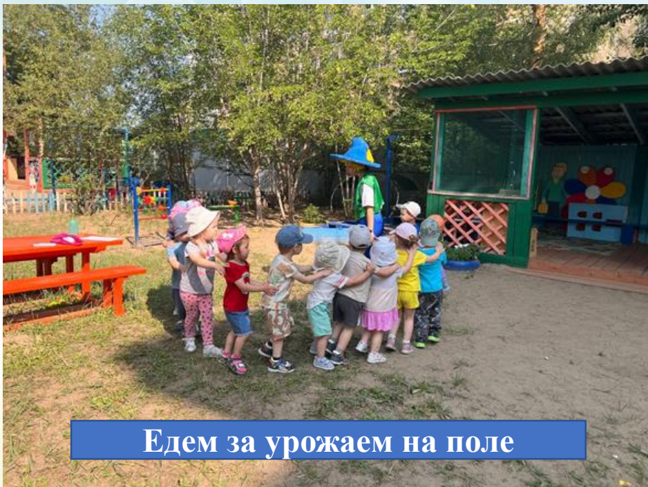
Едем за урожаем на поле