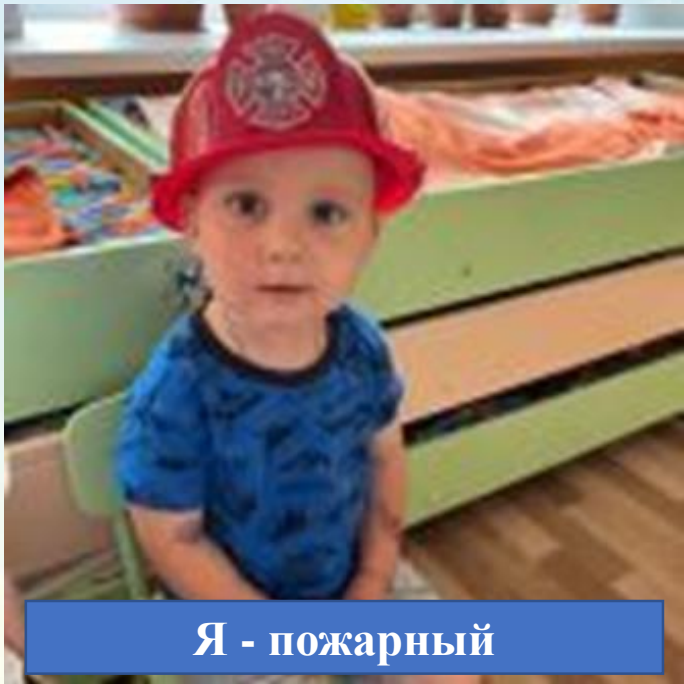
Я - пожарный