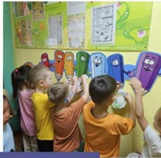
Рисование "Витаминная тарелка"