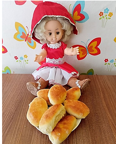
Творческая мастерская «Тфелька для Золушки»