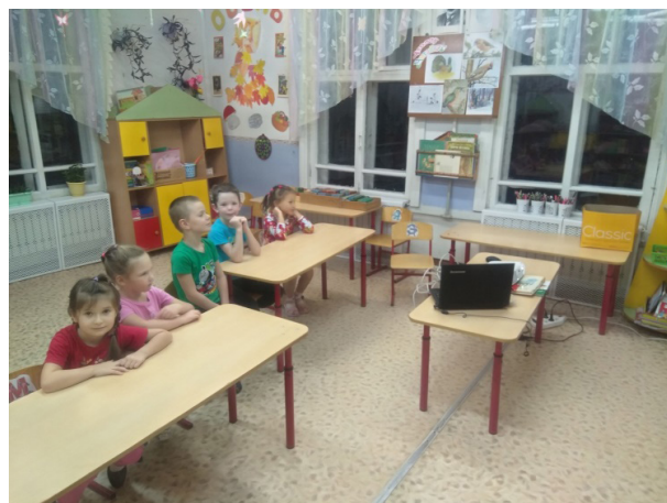
Рис. 2. Просмотр презентации «Всё о глине»