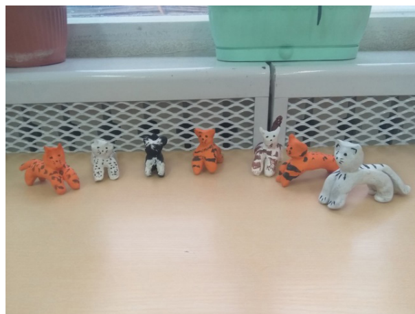
Рис. 5. Выставка детских работ