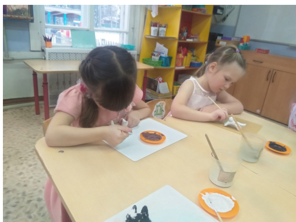
Рис. 4. Роспись изготовленных игрушек