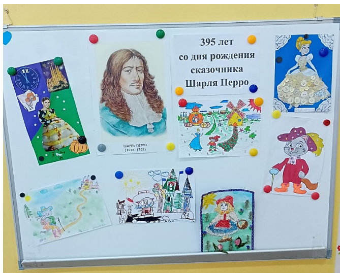
Детские презентации семейных творческих работ по сказкам Шарля Перро