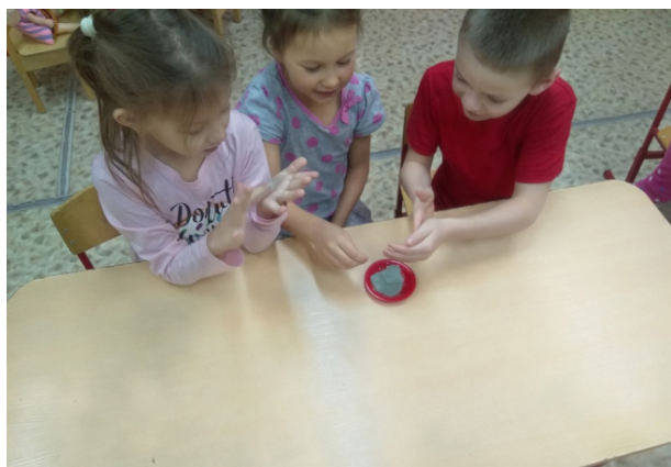
Рис. 1. Опыт познакомиться с особым свойством песка и глины — не пропускать воду