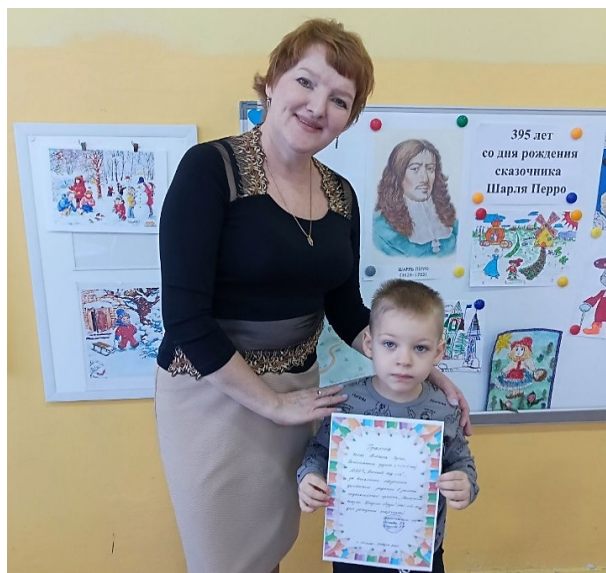
Консультации для родителей