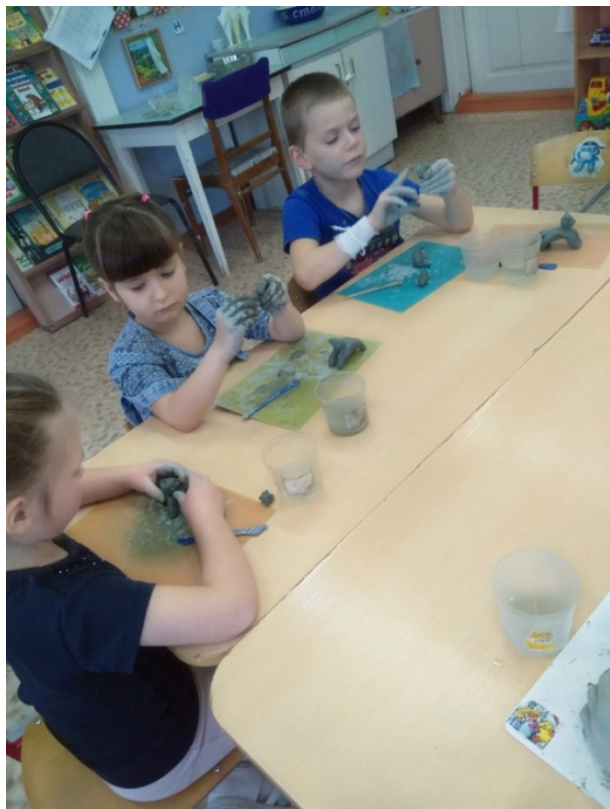
Рис. 3. Изготовление глиняной игрушки – котика