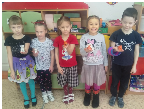
Рис. 6. Готовые котики из глины

В ходе изучения данной темы дети изучили свойства глины, для чего она нужна людям, научились передавать образ животного (кот), совершенствуя приемы работы с глиной, проявляли самостоятельность. Применение в работе различных техник лепки способствует развитию мелкой моторики, что в свою очередь развивает мышление и речь ребенка (рис. 6). Важно продолжать изучать и совершенствовать технику лепки для развития творческих способностей детей.